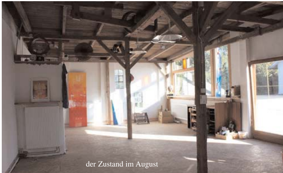
der Zustand im August