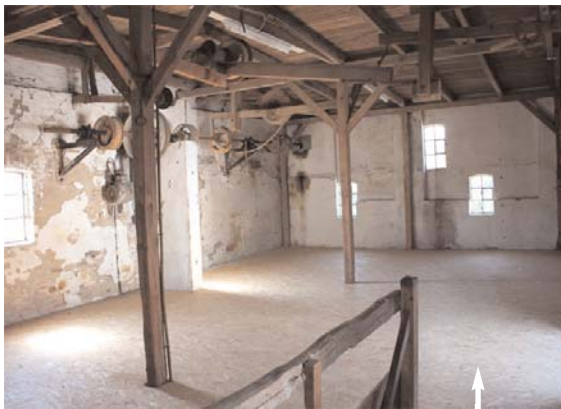
der Zustand im Juni